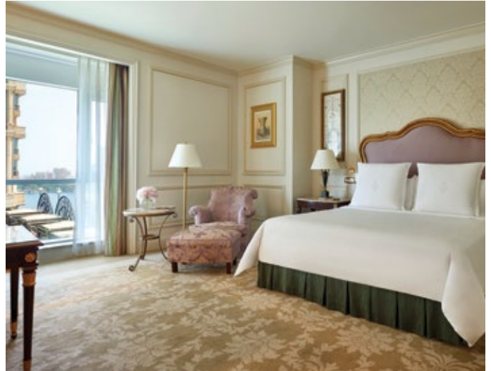
Four Seasons Cairo Cuarto Superior

Rodeado por jardines botánicos y la orilla occidental del río Nilo en el prestigioso complejo First Place de Giza, estarás en el centro de todo. Después de explorar maravillas científicas en sus excursiones, regrese al hotel para relajarse junto a la piscina o disfrutar de un masaje aromático una vez reservado para la realeza egipcia.