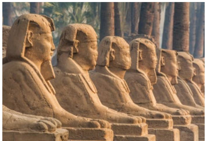
Avenida de las Esfinges, Templo de Luxor, Egipto

Póngase en contacto con su asesor de viajes preferido, llame al 1.800.626.0126 x9489 o visite AmaWaterways.com