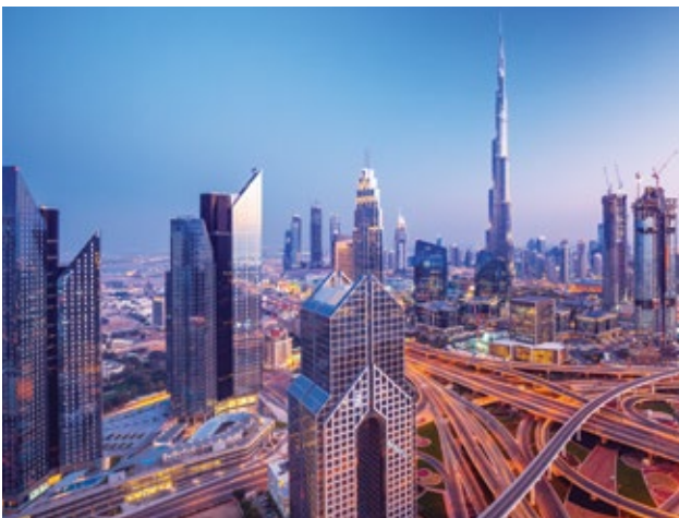
Horizonte de Dubái al atardecer, Emiratos Arabes Unidos

4 noches Jordan: desde $1,949 en doble; $2,924 en sencilla (incluye intraaéreo desde Amán, Jordania a El Cairo, Egipto)