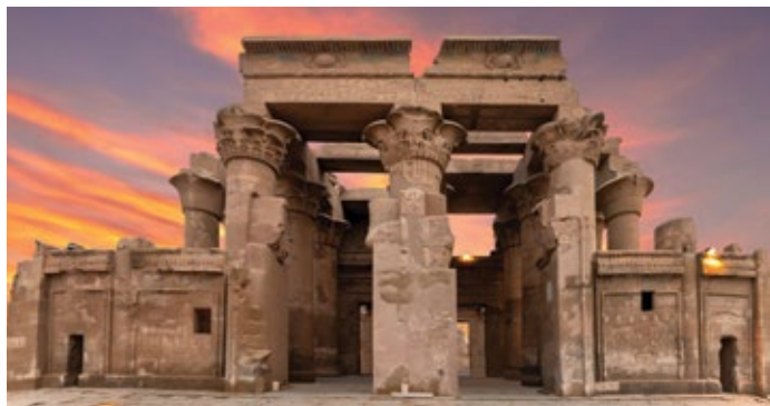
Templo de Kom Ombo, Kom Ombo, Egipto

Durante nuestro itinerario de 11 noches "Secretos de Egipto y el Río Nilo, disfrutará de tres noches de pre-crucero en el Hotel de cinco estrellas Cairo Four Seasons First Residence, así también como un crucero de 7 noches por el río Nilo a bordo de la elegante AmaDahlia y una noche post-crucero en Cairo, lo que le da la oportunidad de explorar sitios codiciados por tierra y río. Descubra maravillas antiguas como el Gran Salón Del Hipoestilo de Karnak, el cautivador Templo de Luxor y el impresionante Valle de los Reyes y Reinas. Enfréntese cara a cara con los tesoros del rey Tut, así como con la Gran Esfinge y las tres pirámides de Guiza; y obtenga acceso privado y exclusivo a la Tumba de la Reina Nefertari y el Palacio Presidencial de Abdeen de El Cairo. Todo esto y más te está esperando en Egipto con AmaWaterways.