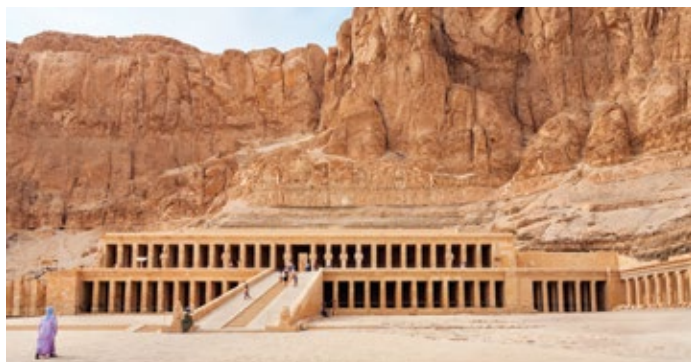
Templo de Hatshepsut en Luxor, Egipto