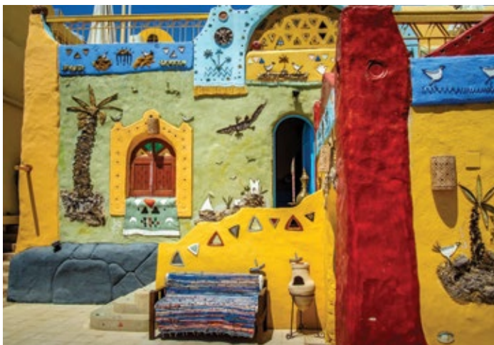
Pueblo de Nubia, Asuán, Egipto