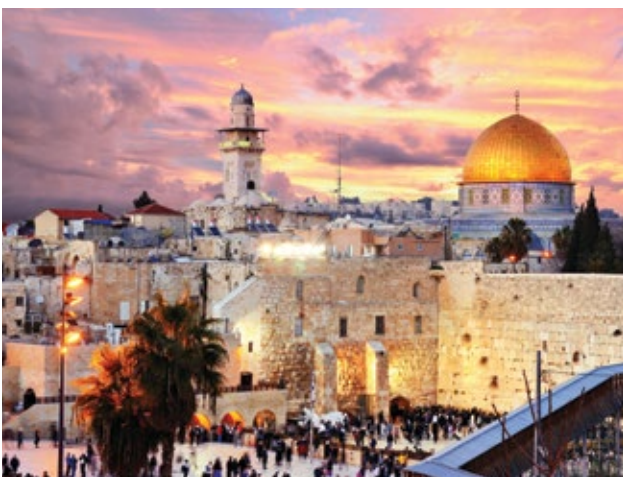
Ciudad antigua, el Muro de las Lamentaciones y el Templo en Jerusalén, Israel

3 noches Dubai: desde $1,499 en doble; $2,249 en sencilla