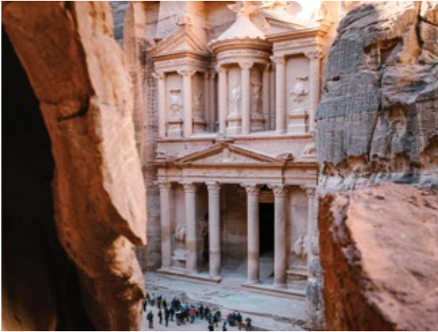
El Tesoro en la antigua ciudad de Petra, Jordania

Mejore su experiencia en Egipto añadiendo aventuras adicionales por tierra y aproveche al máximo su tiempo en esta increíble región del mundo antes o después de su itinerario de 11 noches Secretos de Egipto & el río Nilo añadiendo uno o más de nuestros emocionantes programas terrestres.