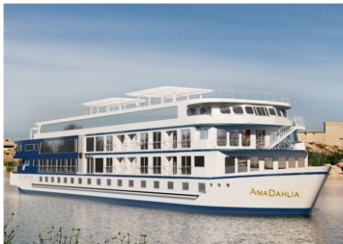
Nueva e Impresionante AmaDahlia (representacion)

La impresionante y recientemente diseñada AmaDahlia es un barco para 68 pasajeros que incluye: 18 Cabinas estándar y 16 magníficas Suites con amenidades que le sorprenderán y deleitarán incluyendo una piscina en la cubierta superior, El Restaurante de la mesa del Chef, el gimnasio el salón de belleza, y el cuaro para masajes.