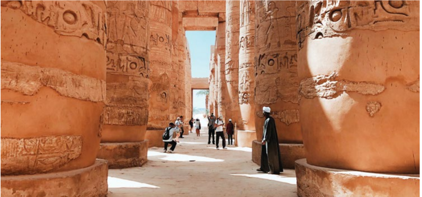
Templo Karnak en Luxor, Egipto

Reserve su itinerario de "Secretos de Egipto & el crucero por el río Nilo y la aventura en tierra antes del 30 de junio de 2020 y recibirá un 5% de descuento en todas las cabinas y suites con balcón, o, ahorre $500 por cabina para las categorías de ventana panorámica D y E.