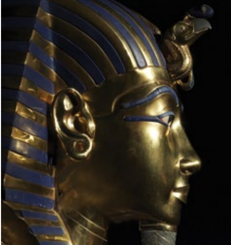
Museo Egipcio y Tesoros del rey Tut, El Cairo