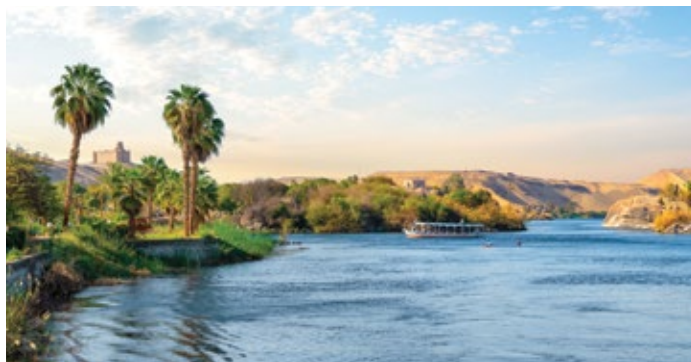
Vista del río Nilo en Asuán, Egipto